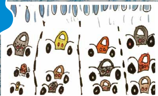
van ASSEN naar ZWOLLE